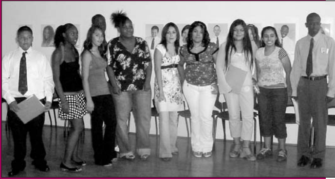
GOALS participants gain valuable life skills.

The GOALS (Gaining Opportunities Achieving Life-long Success) Program, coordinated by the city of Phoenix Housing Department, provides youth the unique opportunity to learn valuable life skills while participating in etiquette classes. Seventeen youth from Marcos De Niza, Henson Village, Sidney P. Osborn, Luke Krohn East, Luke Krohn West and Foothills public housing sites, attended an 8-week series of professional etiquette classes which taught them how to make a positive impression in business and personal situations. At the end of the 8-week series, a graduation ceremony took place at the Emmett McLoughlin Community Training and Education Center, where all participants were given an opportunity to share what they had learned. Congratulations to all of the participants! The GOALS Program is currently accepting public housing youth residents from 13 to 17 years of age to participate in classes and workshops. Eligible youth interested in joining the GOALS Program may call Kelly at 602-534-4575 or Clara at 602-262-6231 to register.