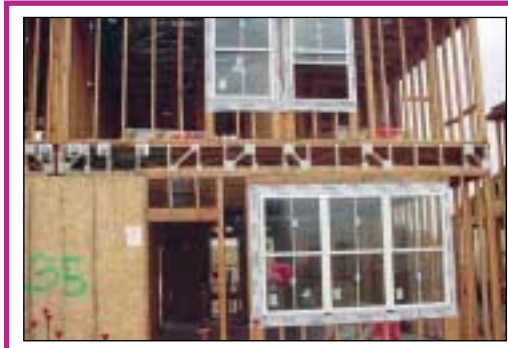
Phase 1 unit with upgraded dual pane windows

negative impact on people, non-toxic materials will be used and ventilation properly constructed.