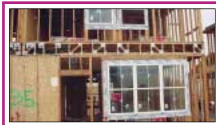
Unidades de la primera fase con ventanas dobles mejoradas.

El concepto "Ecológico" es un enfoque de sistemas completos utilizando un diseño equilibrado y materiales de construcción