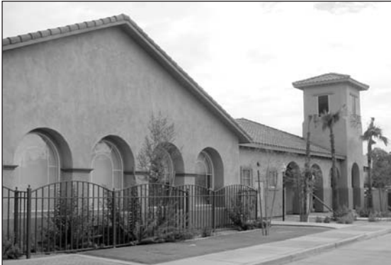
Emmett McLoughlin Center, 1150 S. Seventh Ave.

The new Emmett McLoughlin Community Training and Education Center (CTEC) located at 1150 S. Seventh Ave., is home to the HOPE VI Project Community and Supportive Services Program (CSS), which provides numerous social services to Phoenix residents to improve their quality of life.